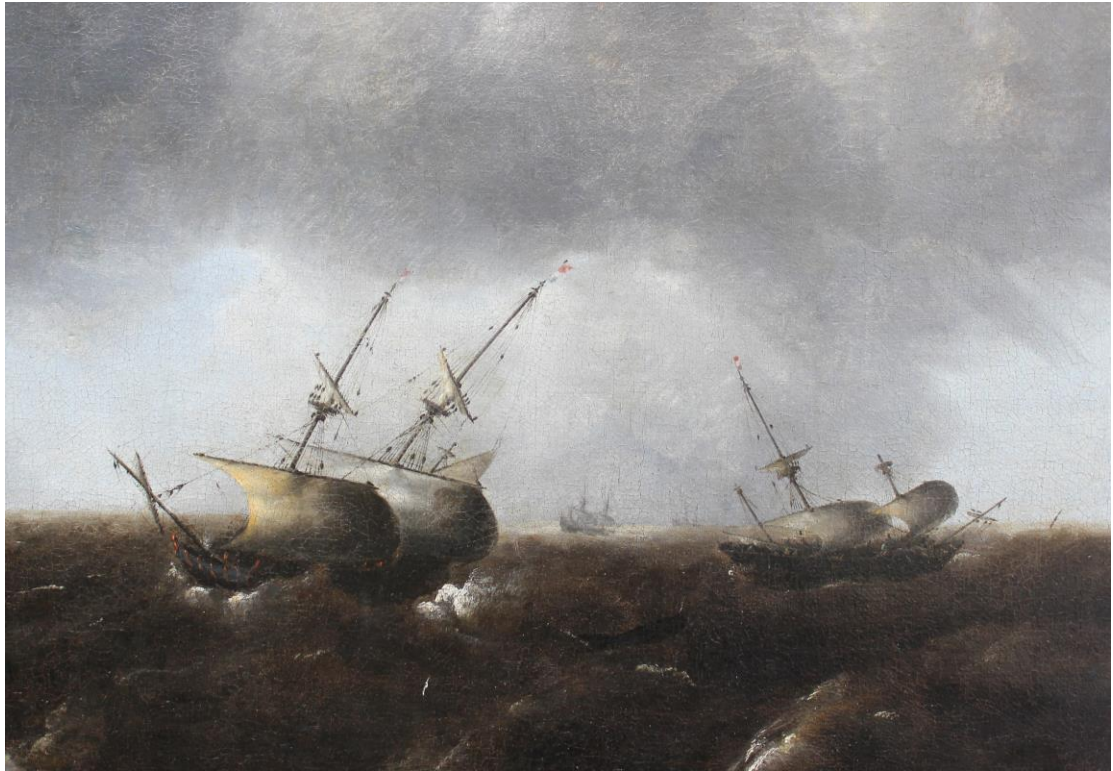
Fragment voor en na restauratie.